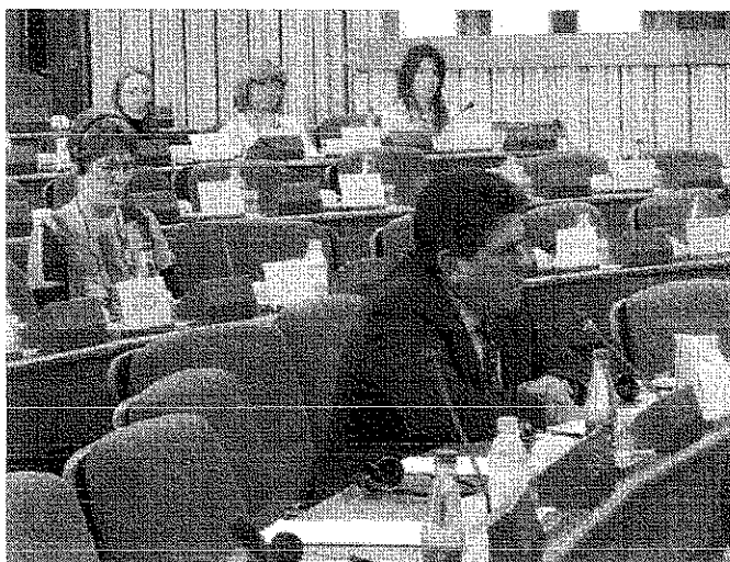
El Diputado Tomás Torres. Detrás, la eurodiputada Satu Hassi.

Por su parte, el Diputado mexicano, Tomás Torres (PVEM), destacó las iniciativas que ha impulsado el Partido Verde Ecologista de México dentro del Congreso mexicano, en materia medioambiental, para contar con un marco jurídico adecuado para contrarrestar los efectos del cambio climático.